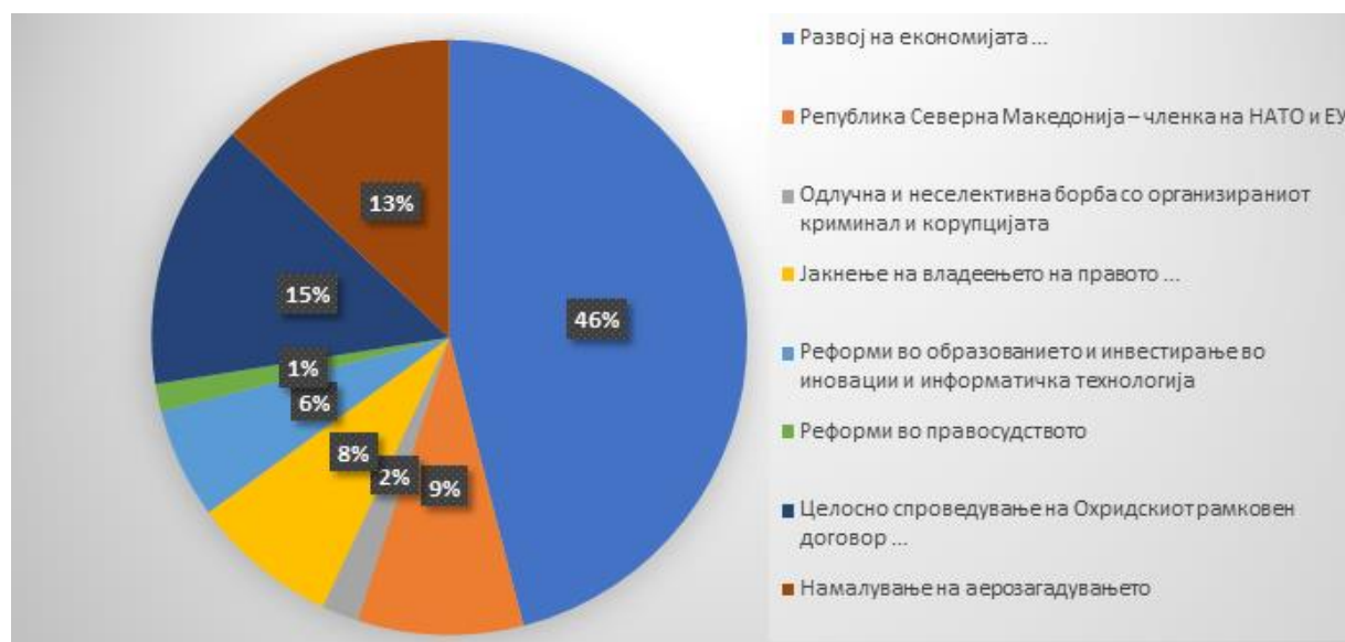
Графикон 1: Број на пријавени предлог-проекти по приоритетни области

Владата на Република Северна Македонија на седницата одржана на 3.9.2019 година донесе решение за именување претседател и членови на Комисијата за распределба на финансиски средства наменети за финансирање на програмските активности на здруженијата и фондациите од Буџетот на Република Северна Македонија за 2019 година. Со цел зголемување на транспарентноста и подобрување на квалитетот на процесот на