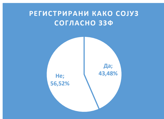
Графикон 2. Регистрирани мрежи согласно ЗЗФ (%)