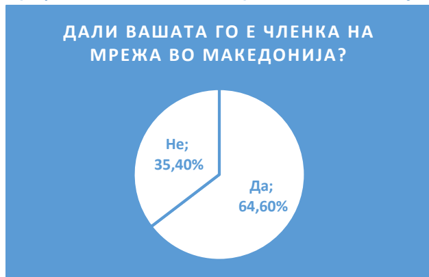
Графикон 1. Членство во мрежи во Македонија